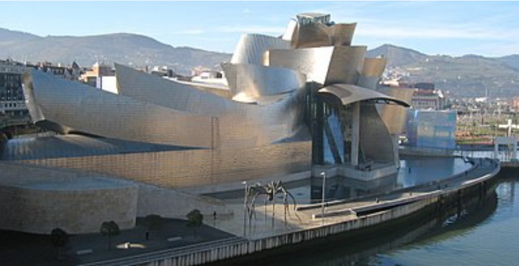
Postmodern mimari örneklerinden Guggenheim Müzesi - Bilbao